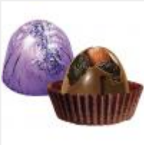
Вулкан ООО "КДВ" г Воронеж