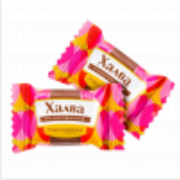
Халва в шоколаде ООО "Азовская кондитерская фабрика" г Азов