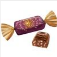
Версаль Яшкино ООО "КДВ" г Воронеж