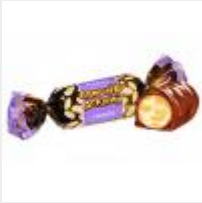
Самый Дерзкий КФ "Сладуница"