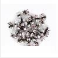
Драже кремовое "Панда" ООО "Гранд Кенди" г Ереван