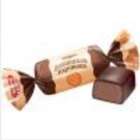
Яшкинская картошка ООО "КДВ" г Воронеж