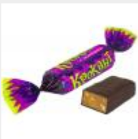
Крокант Яшкино ООО "КДВ" г Воронеж